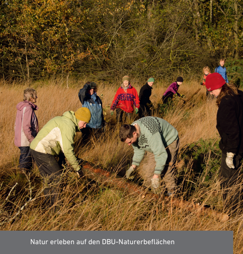
Natur erleben auf den DBU-Naturerbeflächen