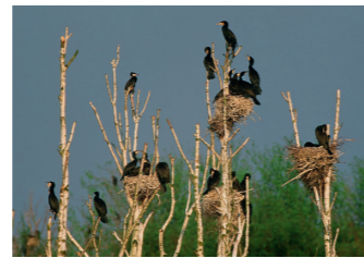
Impressionen aus dem Naturerbe