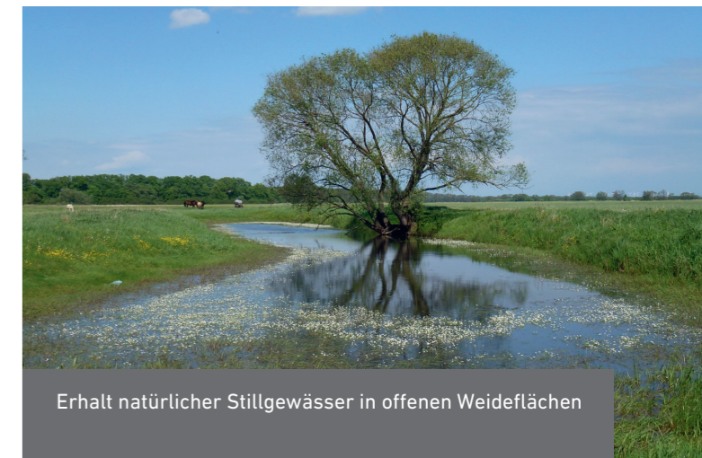
Erhalt natürlicher Stillgewässer in offenen Weideflächen

Feuchte bis nasse Standorte sind Voraussetzung für das Überleben von angepassten Spezialisten, darunter Biber, Amphibien, Insekten und Orchideen. Da deren Lebensräume in unseren Breiten mittlerweile knapp geworden sind, sollen auf allen DBU-Naturerbeflächen Gewässer und Feuchtgebiete bewahrt und optimiert werden, um die ökologischen Bedürfnisse zahlreicher gefährdeter Arten zu erfüllen. Dies geschieht beispielsweise durch eine Wiederherstellung des natürlichen Wasserhaushalts in Niederungen oder die Optimierung und Renaturierung von Gewässern.