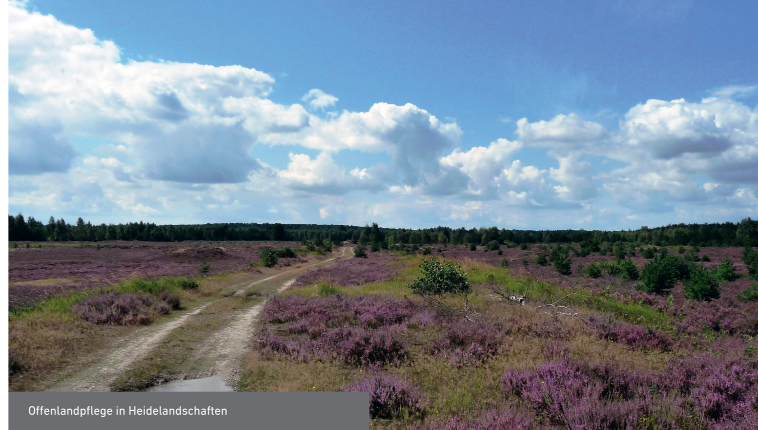
Offenlandpflege in Heidelandschaften